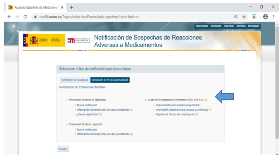
Figura 1. Notificación de sospechas de RAM en estudios postautorización EPAs

Las sospechas de reacciones adversas que se detecten en estos